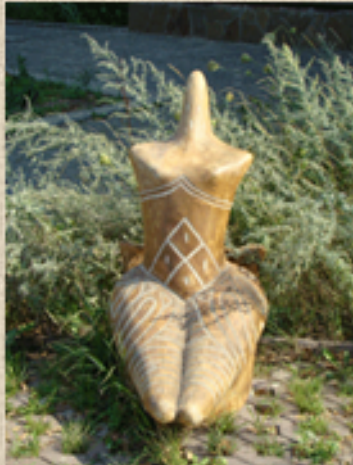
Жіночі фігурки Трипілля