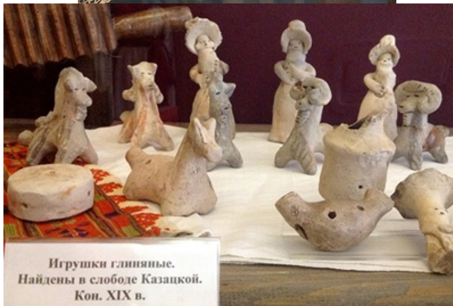
Игрушки глиняные. Найдены в слободе Казацкой. Кон. XIX в.