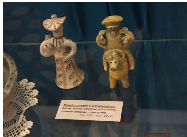
Вироби сільщини Слобожанщини: банка, миска, Іранки, каші нічні, слив'яні Іранки – сеструнці, Кін. XIX – поч. XX ст.