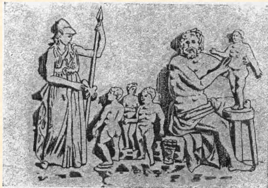
Прометей лепит людей из глины.