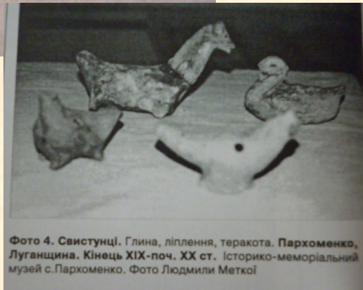
Фото 4. Свистунці. Глина, діплення, теракота. Пархоменко, Луганщина. Кінець XIX-поч. XX ст. Історико-меморіальний музей с.Пархоменко.