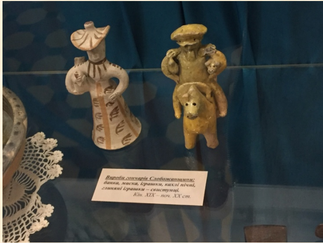
Вироби гончарів Слобожанщини: банки, миска, бранки, вазли пісні, глиняні іграшки – свистунці, кінь XIX – поч. XX ст.

Бариня з куркою-свистком, вершник, кінець XIX ст., КЗ “Харківський історичний музей ім М.Ф Сумцова” (зліва). Фото автора, 2018 р. Свистунці та брязкальце, кінець XIX ст., Старий Оскіл. Фото 2016 р.