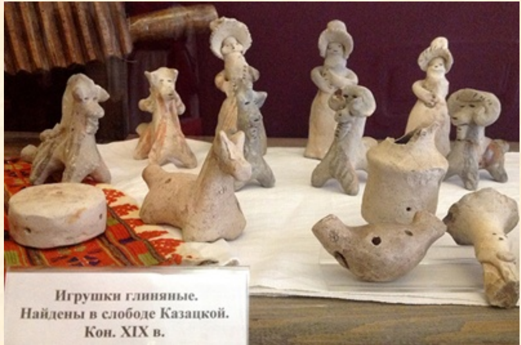
Игрушки глиняные. Найдены в слободе Казацкой. Кон. XIX в.