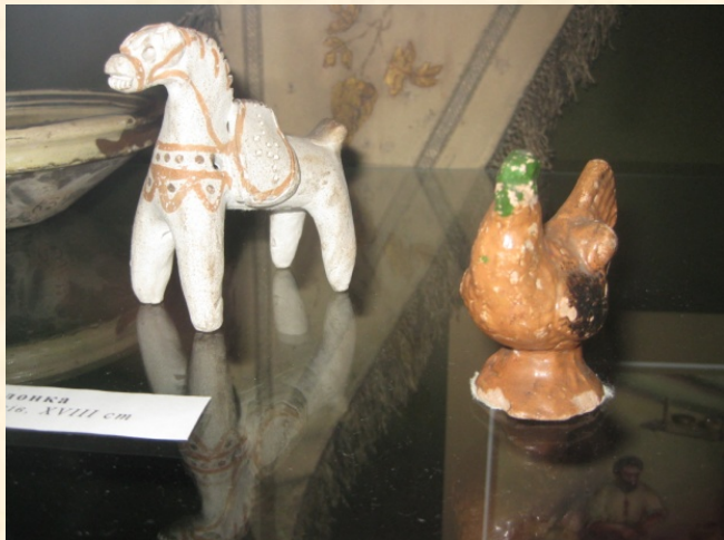
гонка 18. XVIII ст